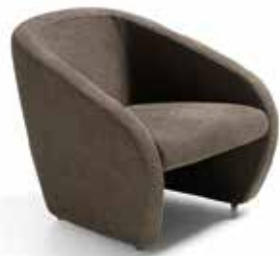
Betty cm. 72x77x70