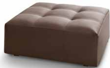
Modular pouff cm. 98x98x40